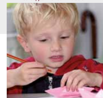
scheepjes in elkaar knutselen