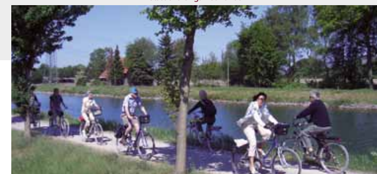
fietstocht langs het kanaal

De gastrobus – een Londense dubbeldekker uit het jaar 1959 – biedt U een kleine keuze aan spijzen en dranken aan. Bij mooi weer zit U buiten en geniet U van het uitzicht op schepenlift en kanaalover.