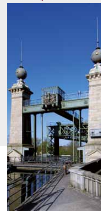
bovenste gedeelten hoofdtorens

grootste bouwwerk aan het Dortmund-Ems-Kanal nog steeds de bewondering van de bezoekers. Het gigantische hijstuig ligt intussen meer dan 40 jaar stil. In ons museum komt de geschiedenis van de lift en van de mensen die aan het kanaal werkten weer tot leven.