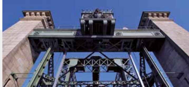
indrukwekkend industrieel monument