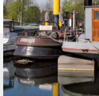
historische schepen langs de bovenloop