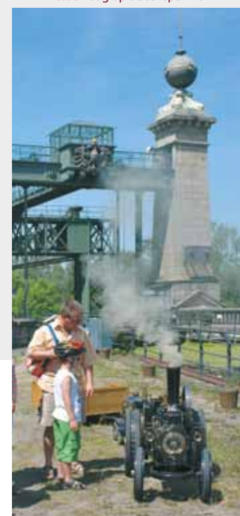
stoomdag op de schepenlift

Alle gegevens vindt U op internet. Graag sturen wij U onze programmagegevens toe