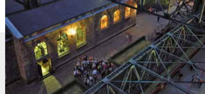
avondrondleiding op de verlichte schepenlift